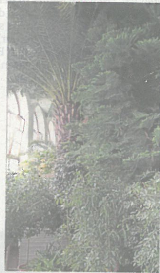
Auszeit in einem Biotop mitten in der Stadt. MAMAZA

Mamaza: „Garden State“ , Eröffnung 9.1., 20 Uhr, bis 12.1., 20 Uhr, täglich von 11 Uhr bis Mitternacht, Frankfurt, Mousonturm, Waldschmidtstr. 4, Kartentelefon: 069/40 58 95 20